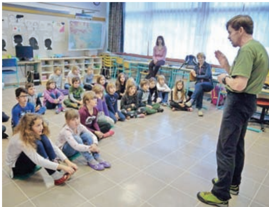
Otroci so z zanimanjem prisluhnili lovskemu čuvaju Davu Karničarju.